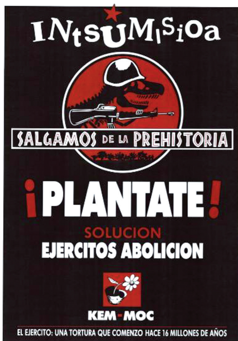
Irudia 3 Salgamos de la prehistoria , 1993.

Koloreari dagokionez hiru kolore ageri dira, alde batetik txuria, kasu honetan haren zentzua fondo beltzarekin kontrastea egitea da. Beltzaren erabilera txuriaren erabilera berdintsua izango zen, kontratastea eta estetika kontuak jarraitzea. Aldiz, gorriaren erabilera filmaren estetika jarraitzen du eta bestetik, odolarekin erlazio-