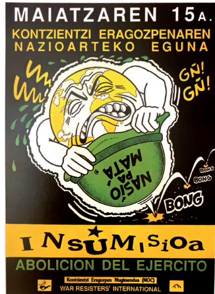
Irudia. 2 Kontzientzia eragozpenaren nazioarteko eguna, 1990 (Ubierna 3, 1997).

Azkenik, kaskoaren barnean garrantzizkoa da agertzen den mezua «nasió pa matá», hiltzeko jaioa, geroago landuko dena. Azkenik, beheko aldean bi logotipo agertzen dira, alde batetik MOC-ena (margarita eta kaskoa) eta bestetik arma bat erditik puskatuta, honakoa ez du soilik MOC erabiltzen baizik eta antimilitarismoaren ikur da, zehazki War Resister's International , Gerrenganako Erresistentzia Internazionala taldearena, MOC horren parte dena, berriz ere, haren izaera internazionala agerian utziz.