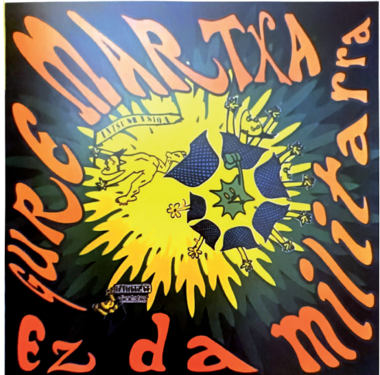
Irudia 6 Gure martxa ez da militarra, 1994 (Ubierna 3, 1997).

Bestetik, bigarren plano batean, koloreen bitartez forma emanda, lore baten antza duen elementua dago, «meacamas» ( taraxacum officinale ) edo eguzki-lorearen antza duten hostoen forma irudikatuz. Bigarren aukera zentzu gehiago edukiko zuen, azken batean eguzki-lorea euskal kulturarekin lotura zuzena duelako. Azke-