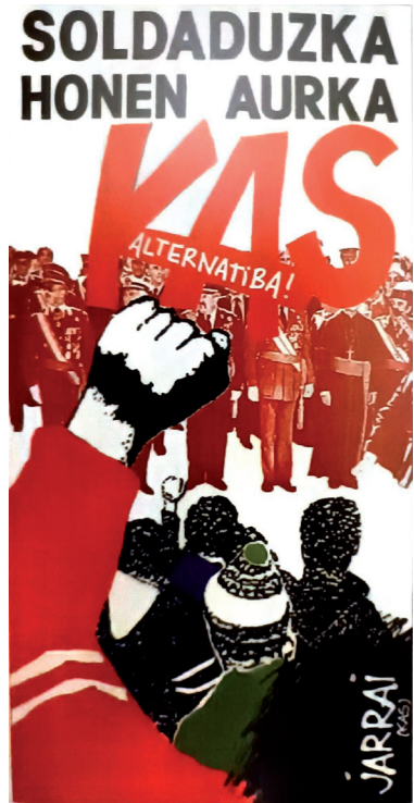
Irudia 8 Soldaduzka honen aurka, 1988 (Ubierna 3, 1997).

«Soldaduzka honen aurka. KAS alternatiba», JARRAI-k eta Ezker Abertzaleak 80-90.eko hamarkadan Espainiar ejertzitoan soldaduzka egitearen kontra azaldu ziren, kontuan izanda Kakitzak edota KEM-MOC presentzia nabarmena izan zuen taldea dela. Bereziki, biolentzia eta bestelako soldaduzka bultatzen zituzten. Gorripatzekoa da, «Alternatiba» hitzak, 1976ko abuztuan, KAS alternatiba aurkeztu zen, hego Euskadin aurrera eramane beharreko pausuak zehaztuz zeinetan, frankismo-