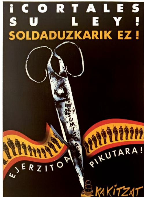
Irudia 4 ¡Cortales su ley! Soldaduzkarik ez!, 1984 (Ubierna 3, 1997).

Honako kartelean lehen ikuspuntuan guraize itxi batzuk ageri dira, haien barnean intsumisioa hitza ageriz. Bigarren maila batean beheko zonaldeko zabalera okupatuz, bi zinta zati moztuak, hauek Espainiar bandera islatuz. Banderaren barnean soldaduen silueta ageriz, errepi-