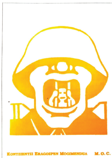
Irudia. 1 Kartel mutua. (Ubierna 2, 1997).

Esan dezakegu KEM-MOC lehenetarikoa izan zela kolore hau erabiltzen mugimendu sozial batean. Horretan oinarrituz eta gaur egunera etorritik, horia erabiltzen da, bai talde politiko eta gizarte mugimenduetan. Azken aldi honetan esaterako, oposizio eta estatuaren kontra joateko taldeek eta mugimenduek erabili dute, esaterako «Proçes», frantziako «Gilets Jaunes» edota Carlos III Ingalaterrako erregearen koroatzearen, haren kontrako ekimenetan horiz jantzi baitziren. Beraz, gaur egun baita salaketa adierazteko kolore bezala erabiltzen da.