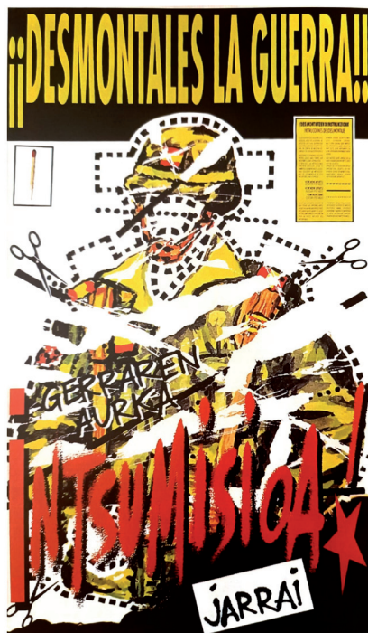
Irudia 9 ¡¡Desmóntales la guerra!! Intsumisioa, 1990 (Ubierna 3, 1997).

Azkenengo kartel hau, besteak baina askoz ere konplexutasun handiagoa erakusten du, elementuei dagokionean. Ikuspuntu bezala kartel gehiena okupatzen duen espazioa, soldadu bat da, honakoa ebakitzekoa izango balitz. Ebakitzeko honen ondoan, bi guraize ageri zaizkigu irudikatuz «nondik» moztu behar den. Gainera, mozteko lerroak, soldaduaren lepotik eta aurpegitik pasatzen dira, honakoa «akatzeko» edo «hiltzeko», ongi adieraziz zeren kontra doazen. Are gehiago, soldadu hau ez da edozein herritakoa Espainiarra dela irudikatu dute eta